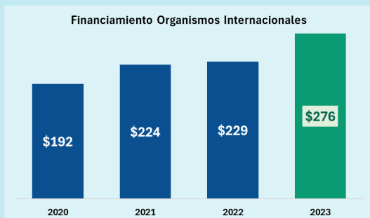
Valores en millones de USD

“Acompañar a quienes trabajan por un futuro mejor”